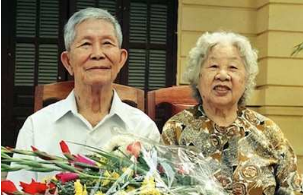
Ông bà Trần Văn Giàu những năm cuối đời (ở nhà riêng 70 Phạm Ngọc Thạch, TP HCM)

lớn dù nhỏ, dù an dù nguy mà Đảng cách mạng cần. Đó là những anh chị em “thoát ly gia đình”, làm “cách mạng chuyên nghiệp”. Loại cán bộ này trong Đảng Cộng sản đông tới hàng trăm. Tôi là một trong số đó. Từ cuối năm 1930, tôi đã bắt đầu “thoát ly gia đình”, và trở thành người hoạt động “cách mạng chuyên nghiệp”.