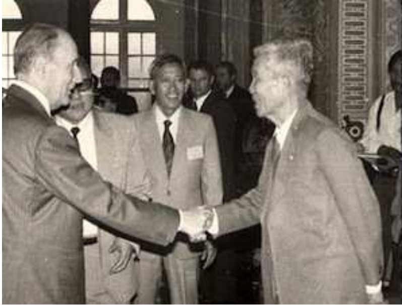
Trần Văn Giàu gặp F. Mitterrand tại TP. HCM trong chuyến đi thăm Việt Nam của tổng thống Pháp (1993). François Mitterrand thua ông 5 tuổi, thuở trẻ thuộc phe hữu (thậm chí cực hữu). Khi TVG bị giam ở Tà Lài, FM bị bắt làm tù binh ở Đức. Cả hai vượt ngục thành công. Năm 1943, TVG làm bí thư xứ ủy Nam Kỳ, FM mới bắt đầu tham gia kháng chiến.