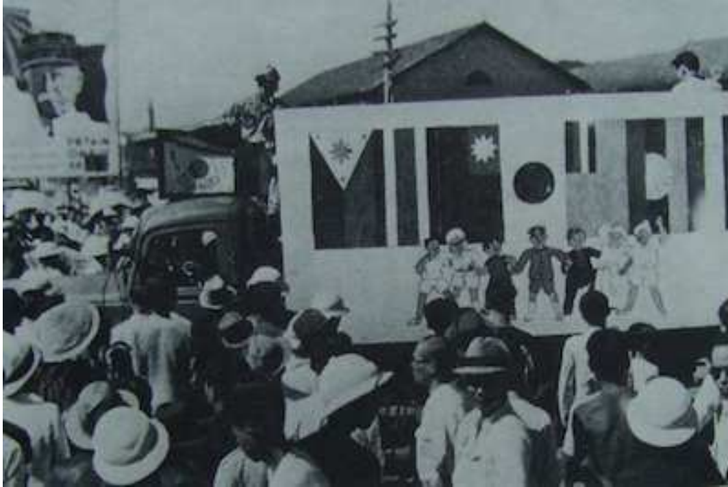
Xe tuyên truyền cho "chủ nghĩa Đại Đông Á" của Nhật ở Sài Gòn. Bên trái là áp-phích ca ngợi thống chế Pétain của Pháp.