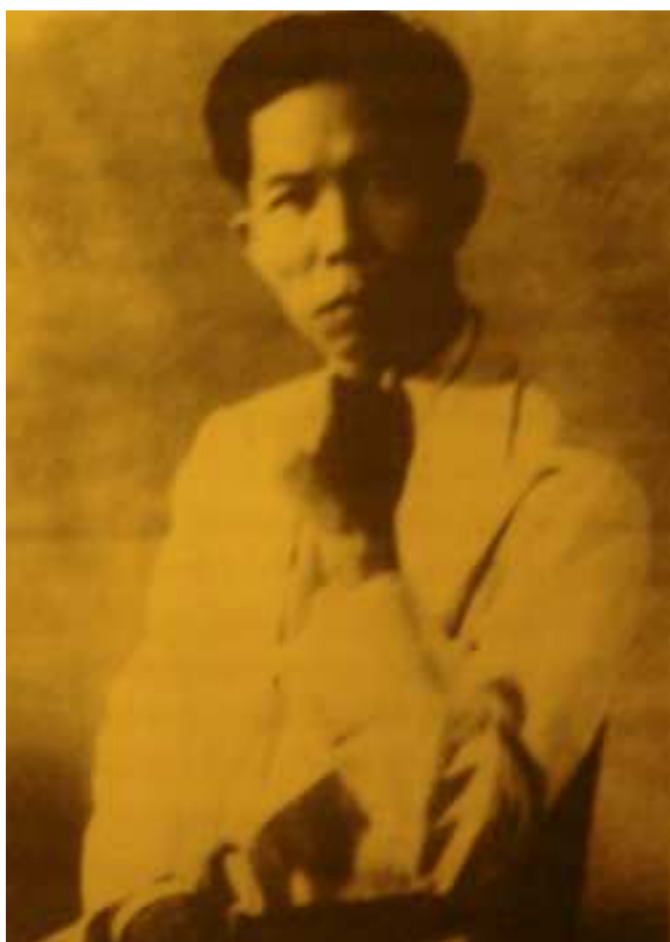
Trần Văn Giàu, thập niên 1940.

Suốt đêm đầu tiên vượt ngục, chúng tôi thay phiên nhau bơi chiếc ghe lườn (xuồng lớn làm bằng cả một thân cây bị khoét ruột bành bĩa), chúng tôi khiêng qua mấy cái thác ; đến gần sáng, ước chừng đã xa trại giam ít nhất cũng mười lăm cây số đường chim bay, chúng tôi kiếm chỗ nước sâu để nhận chìm ghe ; rồi, hành lý trên vai, anh em đi tìm nơi ẩn nấp sao cho có thể quan sát được xung quanh mà người khác thì khó trông thấy mình ; đường đi không để dấu chân, không gãy cành khô, không bẻ cành non, không rơi vãi một chút giấy lộn ; nơi ẩn đó phải có nước uống ; tránh mưa không phải là vấn đề quan trọng, độ này là mùa nắng, điều quan trọng là phải xa xóm làng mà không xa đường 20. Chúng tôi ăn cơm khô, khoai phải nấu cơm, khoai sợ lộ vì khói. Nếu rủi bị dân làng trông thấy, thì họ cũng chỉ trông thấy vài người thôi ; tụi tôi chia ra từng nhóm nhỏ vài người, nếu gặp rủi ro không bị tóm cả lũ. Chúng tôi có thừa thời giờ để bàn mọi kế hoạch hành động, trước tiên là kế hoạch an toàn về các tỉnh đồng bằng.