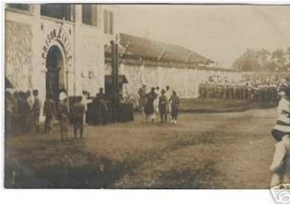
Máy chém đặt trước cổng Khảm

Lớn mỗi khi có cuộc hành quyết (cuối thế kỉ XIX)