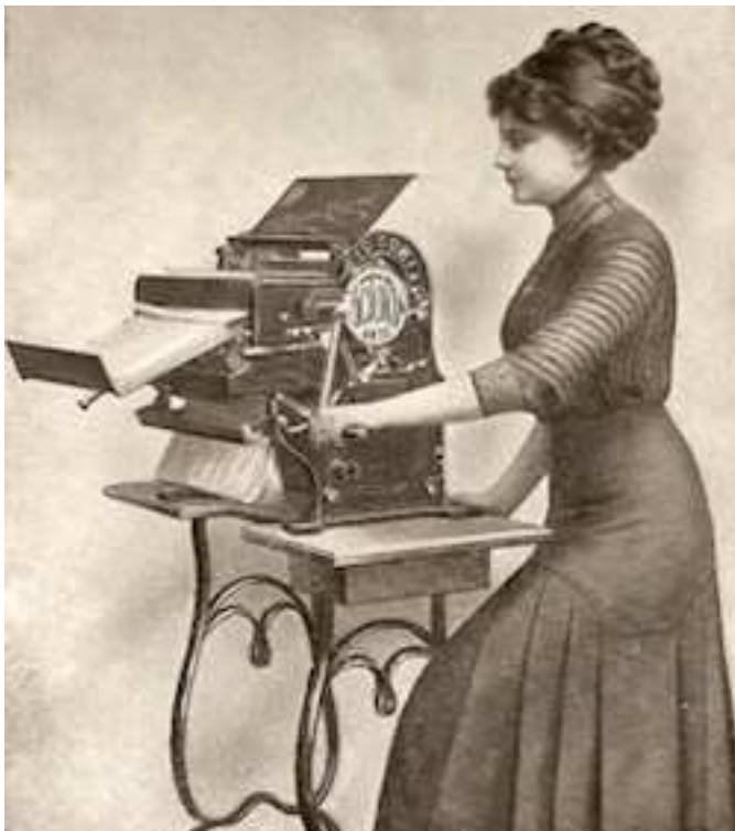
Máy in roneo của hãng Gestetner, mẫu 1913 (quay tay).

Nhưng từ khi ban cán sự Sài Gòn, miền Đông, và Xứ uỷ Nam Kỳ được thành lập lại rồi thì sự tuyên truyền cách mạng phải rộng ra để vũ trang lý luận cho đồng chí, để trong chừng mực có thể, truyền bá rộng đường lối của đảng bộ và đấu tranh chống các tư tưởng địch đang tuyên truyền lúc bấy giờ. Lúc bấy giờ tư tưởng địch, chính trị địch đang quảng bá rộn ràng nhất là “chủ nghĩa liên bang” của Decoux, còn gọi là “Huyền thoại Đông Dương” và chủ nghĩa Đại Đông Á, cũng gọi là “Liên Á” của Nhật. Cả Pháp lẫn Nhật đều dùng tất cả các phương tiện để cổ vũ cho “ chủ nghĩa” của chúng bằng những nha, những hãng thông tin, bằng những đoàn thể thân Pháp, thân Nhật, và chúng tuyên truyền cổ động trên các mặt báo chí, bằng thể dục thể thao, văn hoá, nghệ thuật, giáo dục v.v... Từ giữa 1943 tụi tôi có kế hoạch tuyên truyền cách mạng ở Nam Kỳ, chủ yếu là chống chủ nghĩa Đại Đông Á và chống chủ nghĩa Pháp-Việt để huê mới, và bằng cách đó, khẳng định đường lối chủ trương của Đảng Cộng sản.