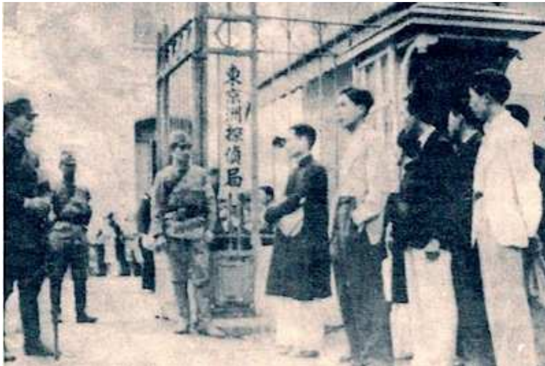
Những người Việt làm việc cho sở Mật thám Pháp trình diện quân đội Nhật trước khi được dùng để phục vụ cho Kempeitai. Biển chữ Hán : Đông Kinh châu lược trình cục / Cục tình báo Bắc Kỳ