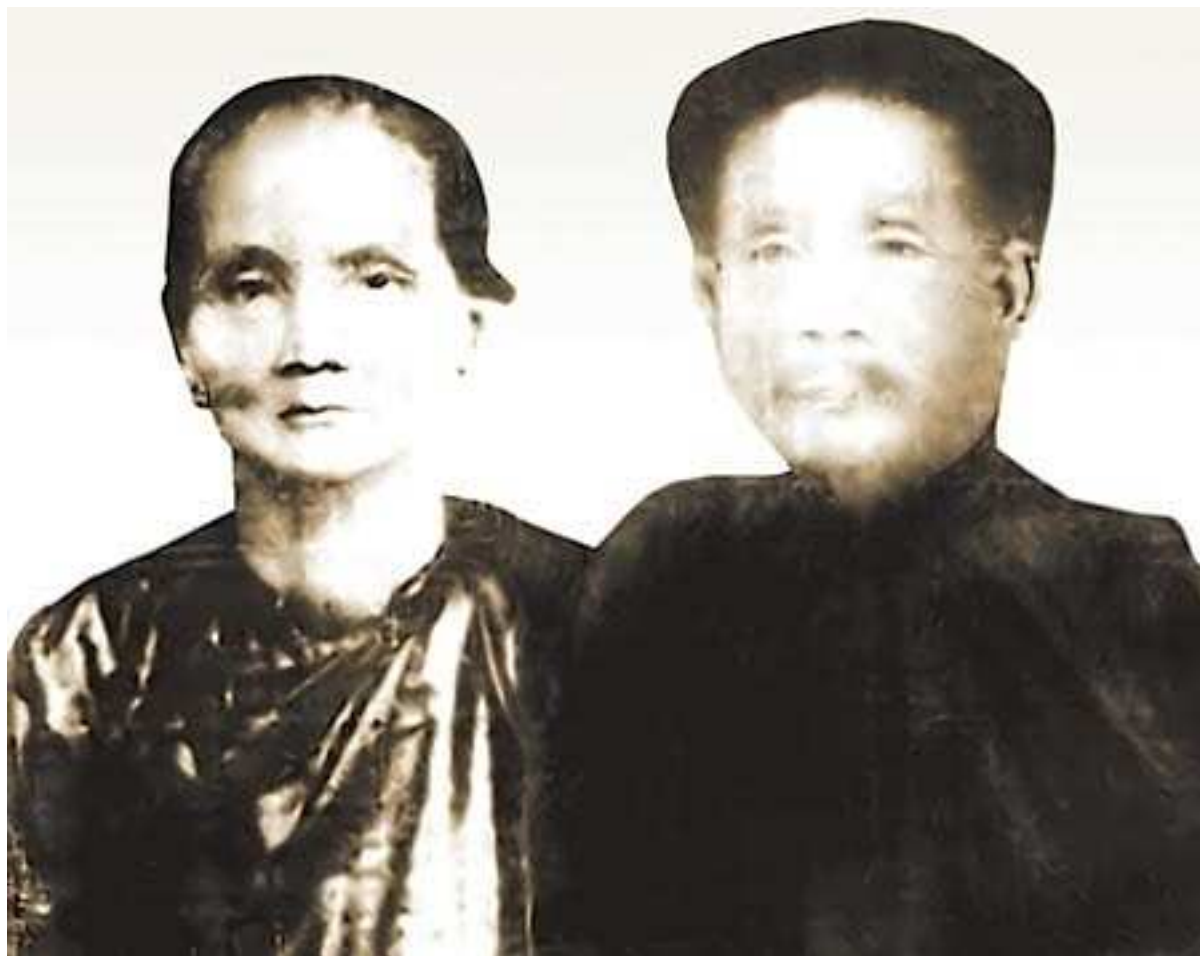
Thân mẫu và thân phụ tác giả

(Mẹ tôi, tuổi quá 80, đã qua đời khi tôi còn ở chiến trường Biền Hồ. Vợ tôi vào bưng biền, làm nhân viên hậu cần cho quân đội, đến 1954 được tập kết ra Bắc).