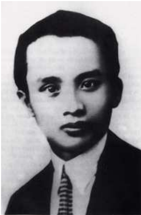
Hà Huy Tập

Trong thời gian hơn ngàn ngày bị cầm cố, biệt giam ở “biệt thự S”, tôi chứng kiến một chuyện mà tôi không bao giờ quên, chuyện “Mắt ngủ” của Hà Huy Tập (5). Tập là một nhân vật mà tôi kính mến. Tập có “đá mốc” tôi mấy đá, khi anh báo cáo với Đông phương bộ, và báo cáo đúng sự thật, là tôi đã phê phán một vài điểm trong “chương trình hành động 1932, của Quốc Tế Cộng Sản” làm giúp cho Đảng Cộng sản Đông Dương (với sự cộng tác của Tập, Toàn (6) và tôi ; vừa được tôi dịch từ bản tiếng Pháp và tiếng Việt). Đá nhẹ mà đau dai !