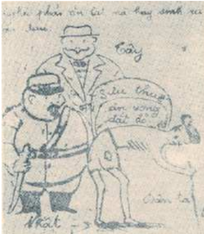
Dân ta dưới ách Tây-Nhật, tranh biếm họa của Nguyễn Ái Quốc (báo Việt Nam Độc Lập)