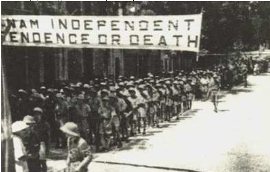
Tuần hành ở Hà Nội dưới khẩu hiệu Độc lập hay là chết !

(Cũng có lúc người ta nói “ Độc lập hay là chết ” 3 là do cách mạng Cuba khởi xướng. Đúng là sau này Cuba đã nêu cao khẩu hiệu “ Độc lập hay là chết ” . Nhưng khẩu hiệu ấy thì nhân dân Việt Nam ở Sài Gòn Nam Bộ đã nêu ra từ ngày 2 tháng 9 năm 1945. Một khẩu hiệu rất tiêu biểu).