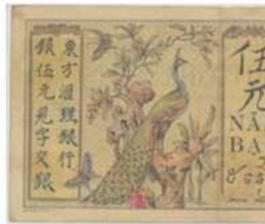
Giấy bạc con công (tiền Đông Dương)