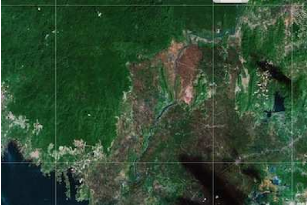
Khu Tà Lài chụp từ vệ tinh : vùng đất màu nâu nhạt ở phía trên ảnh, gần giữa, có dòng sông Đông Nai chảy qua. Góc trái phía dưới : hồ Trị An. Góc phải, phía dưới : đường trắng chạy ngang là đường 20.

Tà Lài nguyên là trụ sở đặc biệt của thực dân Pháp tại vùng người Thượng ở đông và đông bắc Biên Hoà. Xem như một quận lỵ, từ lâu bỏ hoang. Nói là trụ sở, là quận lỵ, chớ thật ra không còn có đâu ! Cư dân ? – Vèn vèn chỉ có một nhà dân núp trong vườn chuối sum sê bên cạnh một bên phà. Công thự ? Chẳng có gì cả ngoài ba cái nhà trệt bằng gỗ lợp có thể chứa một vài ông quan và một vài trung đội lính khố xanh nhưng đã bỏ hoang, không biết từ hồi nào. Ba cái nhà đó ở giữa một khu đất rộng chừng bảy, tám mẫu, cây to cao đã bị đốn sạch, nhưng cây nhỏ và cỏ tranh mọc lên rậm rì, có nơi lút đầu. Ngày chúng tôi lên tới đó thì Tây mới vừa làm xong một cái trại dài bằng tranh tre nửa chứa được khoảng năm, bảy mươi người, một cái nhà bếp, một trạm y tế cũng bằng tranh tre. Từ nay về sau mọi sự xây dựng ở trại giam này đều sẽ do bàn tay của anh em chúng tôi.