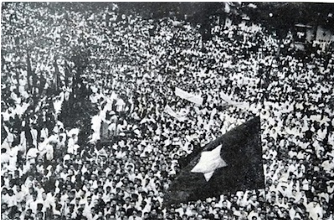
Sài Gòn ngày 25.8.1945

“ Một kỷ nguyên mới trong lịch sử Việt Nam ! Trên một triệu người khắp Nam Bộ và từ Cao Miên về cùng các đại biểu Hoa kiều tham dự cuộc biểu tình Việt Minh, ủng hộ chính phủ cộng hoà dân chủ ”.