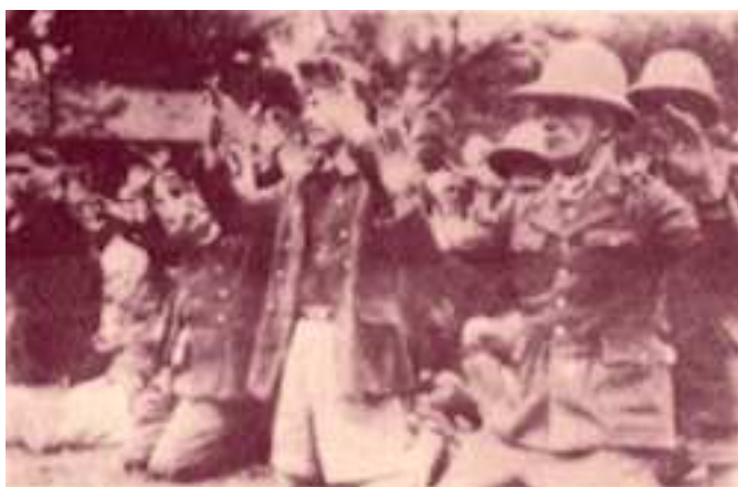
Quân nhân Pháp đầu hàng Nhật, thành Hà Nội 1945

Đồng chí Pháp ở Sài Gòn chỉ có ba anh, họp lại thành một chi bộ đặc biệt (do tôi chỉ đạo trực tiếp 7 ) : một làm ở Sở Vô tuyến điện Đakao, một làm ở thương chánh 8 , một giáo sư trung học. Chi bộ đặc biệt họp ở nhà bên cạnh Sở Vô tuyến điện (bây giờ là đoạn đường Điện Biên Phủ từ cầu đúc lên đường Đinh Tiên Hoàng). Cuộc họp mới bắt đầu ; các đồng chí Pháp đang thông báo về tình hình tư tưởng của các loại người Pháp ở Sài Gòn, về việc bên Pháp De Gaulle chuẩn bị hưởng ứng Mỹ, Tàu đổ quân vào Đông Dương, thì từ phía đường Albert 1er (Đinh