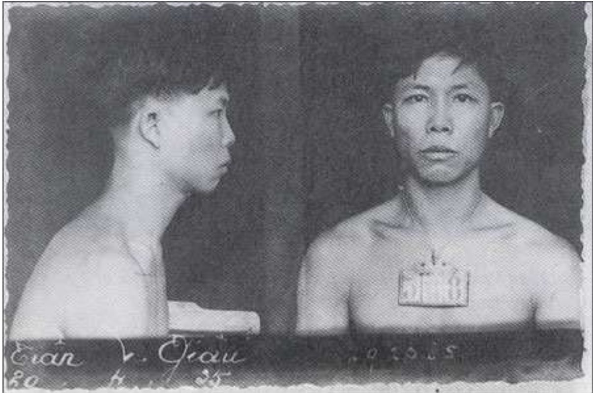
Ảnh căn cước ở nhà tù Côn Đảo năm 1935 của Trần Văn Giàu (số tù 588). Thời đó, ông được gọi là "Giáo sư Đỏ"