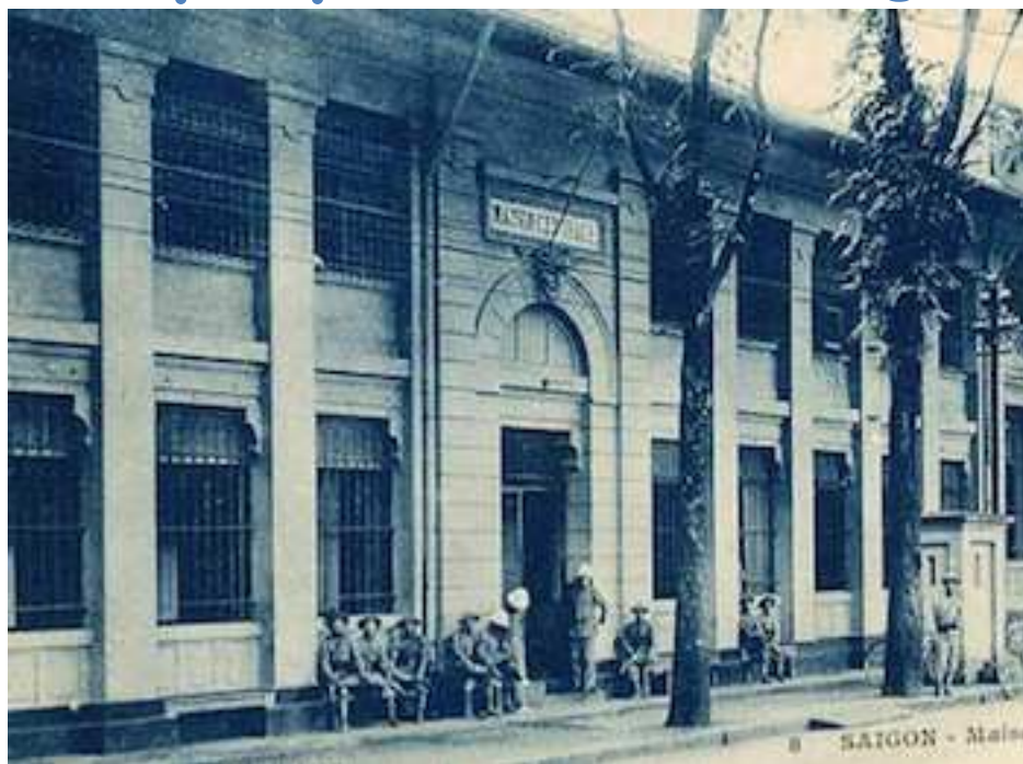
Khám lớn (Maison Centrale de Saigon) những năm 1920, mặt tiền trông ra đường Mac Mahon (Nam Kỳ Khởi Nghĩa)