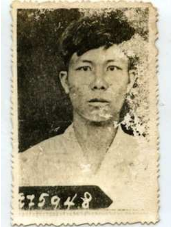
Ảnh căn cước ở Trại Tà Lài (1940)